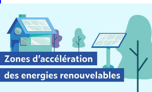
Zones d'accélération des énergies renouvelables

Il a été demandé aux communes d'élaborer une cartographie définissant des zones d'accélération des énergies renouvelables. La commune de Cervon avait donc réuni une commission de réflexion et pris une délibération instaurant une période de concertation avec les habitants qui s'est déroulée d'une part lors d'une réunion publique le 11 mars et d'autre part par la mise à disposition d'un registre du 11 au 18 mars, afin que chacun puisse s'exprimer sur les propositions faites