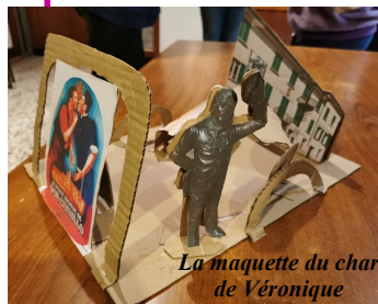
La maquette du char de Véronique