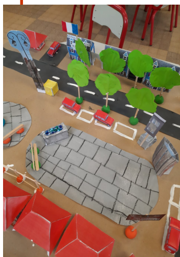
maquette en cours

Leur production sera dévoilée dans le prochain bulletin.