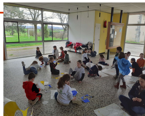
atelier avec Hervé Tullet

Les grands participent à un concours national autour du patrimoine. Ils doivent créer une carte postale (texte et illustration) incitant à venir visiter un monument local. Mais gardons le suspense.