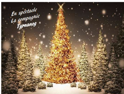
Organisation conjointe Mairie et COFeP

Le Père-Noël apportera les cadeaux aux enfants de la commune (jusqu'à 12 ans) présents ce jour-là. Suivi d'un moment de convivialité pour tous.